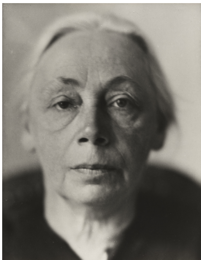
Käthe Kollwitz 1867–1945

Na de stampotmaaltijd volgt een informatief programma over de sociaal-maatschappelijk zeer bewogen Duitse kunstenares Käthe Kollwitz. Käthe Kollwitz wordt beschouwd als één van de belangrijkste Duitse kunstenaars van de twintigste eeuw. Met de komst van het Derde Rijk in Duitsland werd haar werk tot 'entartete Kunst' verklaard, een term die werd gebruikt om kunst aan te duiden die niet aan de eisen van het nazi-regime voldeed. Het oeuvre van deze sociaal-maatschappelijk zeer bewogen kunstenares bestaat uit talrijke tekeningen, etsen, lithografieën, houtsneden en beeldhouwwerken.