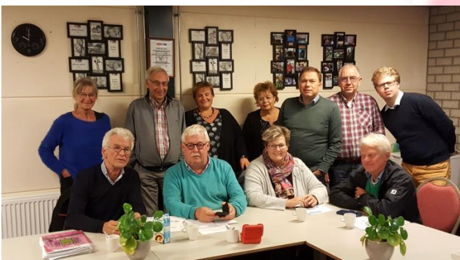
Fotobijlschrift: PvdA Westerkwartier in gesprek met Humanitas, Leergeld en de Voedselbank

PvdA: “Na afloop van het gesprek constateerden we gezamenlijk dat we het niet alleen redden met beleidsnota’s, regelingen en afspraken, daarvoor is het probleem te groot. Wat er nog meer nodig is, is elkaar goed weten te vinden, samenwerken, korte lijnen en maatwerk gericht op het oplossen van problemen. Dat komen we in de praktijk van alle dag onvoldoende tegen. Dit werd duidelijk gemaakt aan de hand van verschillende -vaak schrijnende- voorbeelden. Het is goed om hierover in gesprek te gaan en we hebben afgesproken dit gesprek na de verkiezingen voort te zetten”.