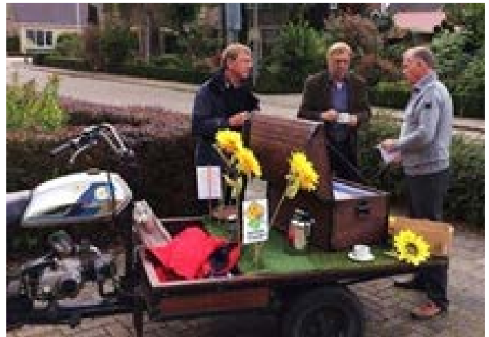
Op bezoek bij Dorpshuis De Welle