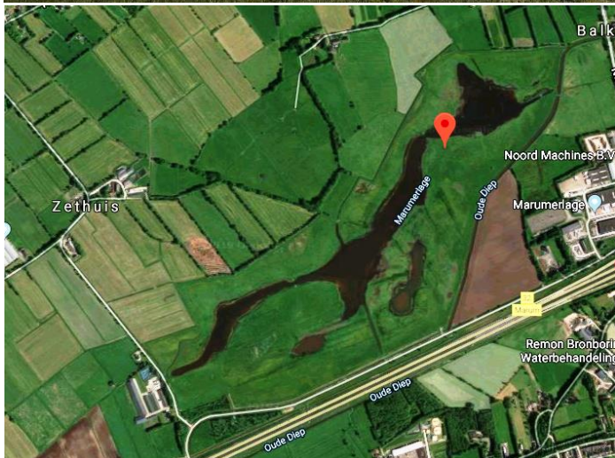
Nieuw landschap – links blik vanaf de uitzichttoren (foto rechts) in Marumerlage, iets ten Noorden van Marum, aangelegd o.a. door Staatsbosbeheer. Je kunt er prachtig wandelen.