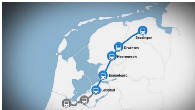
Een mogelijk tracé van de Lelylijn- https://nos.nl/artikel/2339193-onderzoek-nieuwe-spoorlijn-lelystad-groningen-goedkoper-en-snelter Volgens de NOS scheelt de lijn de reiziger 20 minuten tijd.

bij Lathen, ik heb daar in die zweeftrein gezeten. Dat was echt spectaculair. De HSL paste ook in het tijdsbeeld. Na de val van de Berlijnse muur in 1989 was de sfeer optimistisch, Europa 1992 was populair en dat verenigde Europa wilde snelle verbindingen om meer mensen in de trein te krijgen en uit het vliegtuig. Frankrijk had de hoge snelheidstrein (TGV) geïntroduceerd, en Duitsland kwam nu met de magneetzwefbaan. Het kabinet Kok I dat in 1994 aantrad, geloofde in nieuwe infrastructuur, zoals de Zuiderzeelijn, de Tweede Maasvlakte, eventueel een nieuw vliegveld en de Betuweroute. Het reserveerde er miljarden voor. In Noord-Nederland voerde Hans Alders de lobby aan.